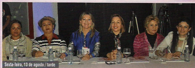
Sexta-feira, 13 de agosto / tarde

Cada sessão de conferências, durante os dias do Temário Científico, contou com uma Mesa Diretora, constituída por profissionais especialmente convidados.